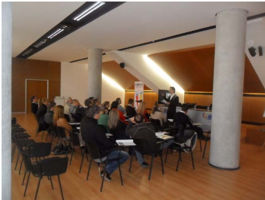
Vista de la sala donde se desarrolló la actividad

Actualmente los jueces de baile deportivo son responsabilidad de la FEBD, ya que solamente existe la categoría de juez nacional. Anualmente se celebra un congreso dirigido a este colectivo que es obligado asistir ara poder juzgar durante la temporada.