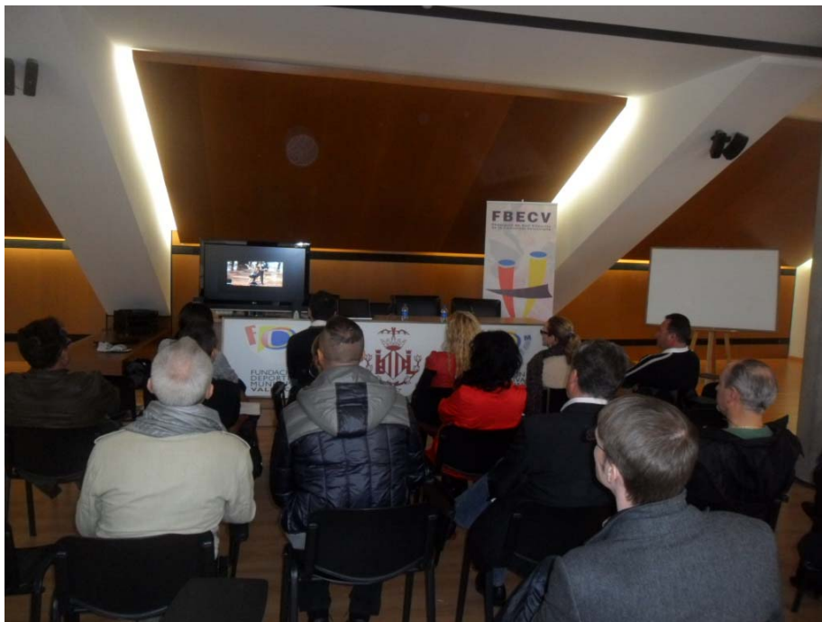
Una de las sesiones de visionado de videos